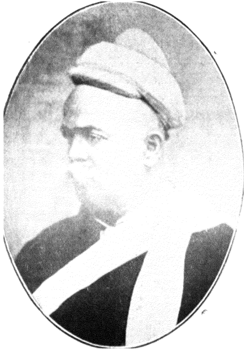
महादेव गोविंद रानडे